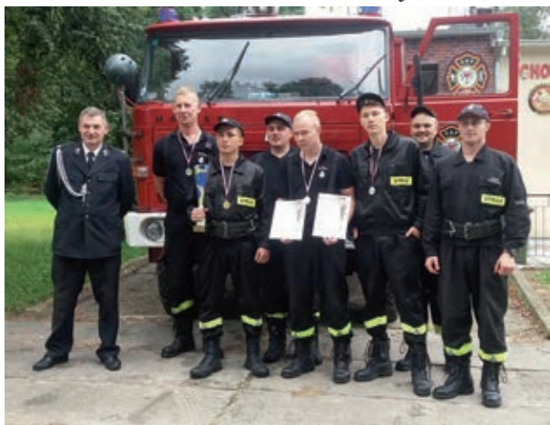
fol. R. Rabcewicz