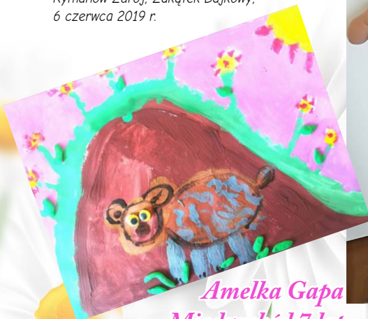
Amelka Gapa Międzzychód 7 lat