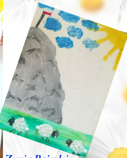
Zuzia Bajerlein Poznań 11 lat