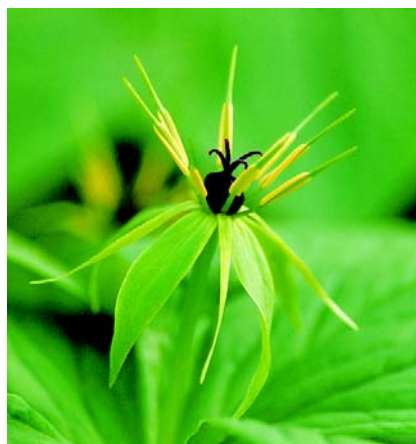
3. Czworolist pospolity